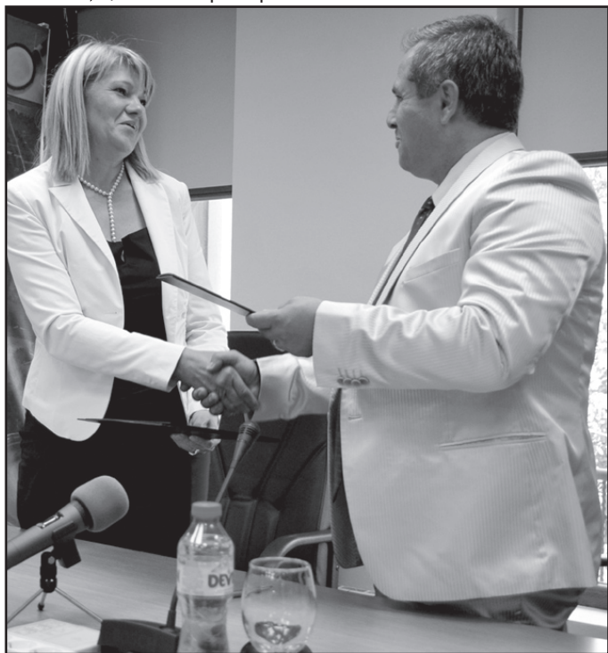
Три години след подписването на договора за пречиствателната станция първият етап от водния цикъл на Созопол трябва да бъде готов

на рибка". Основните дейности в рамките на проекта за водния цикъл на Созопол са подготовка и провеждане на процедури по избор на изпълнители, проектиране и изграждане на ПСОВ за пречистване на отпадъчните води на Созопол и Черноморец и изграждане на ВиК структура на двата града.