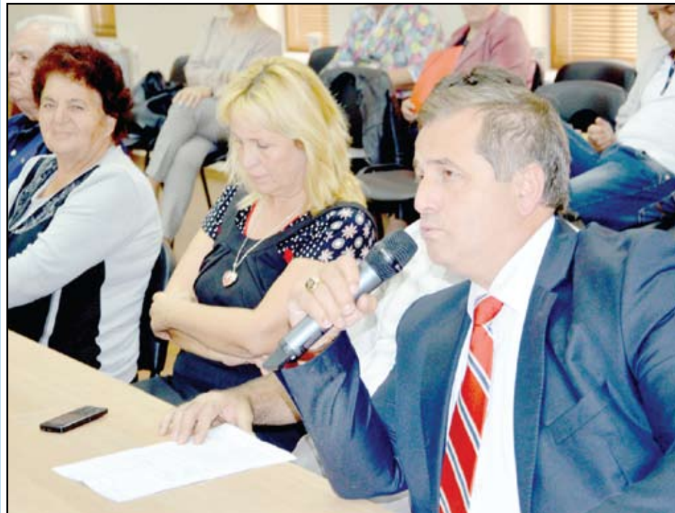
Кметът на община Созопол Панайот Рейзи представи основните приоритети до края на мандата си

Основните задачи, които предстоят пред местната власт-общинска администрация и общински съвет, очерта кметът на община Созопол Панайот Рейзи по време на първата сесия на общинския съвет след лятната ваканция.