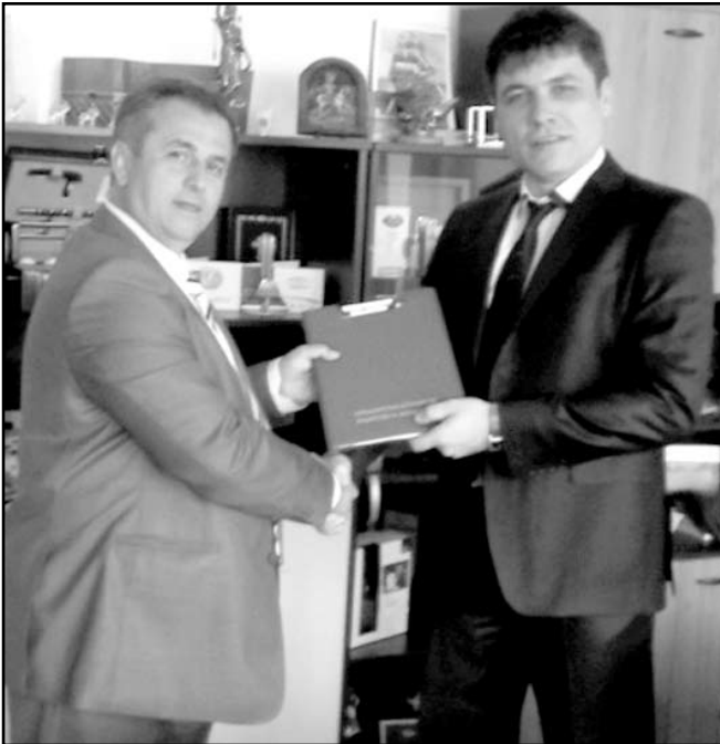
Момент от подписването на договора за безвъзмездна помощ за проект „Инвестиции в съществуващо рибарско пристанище гр.Черноморец“