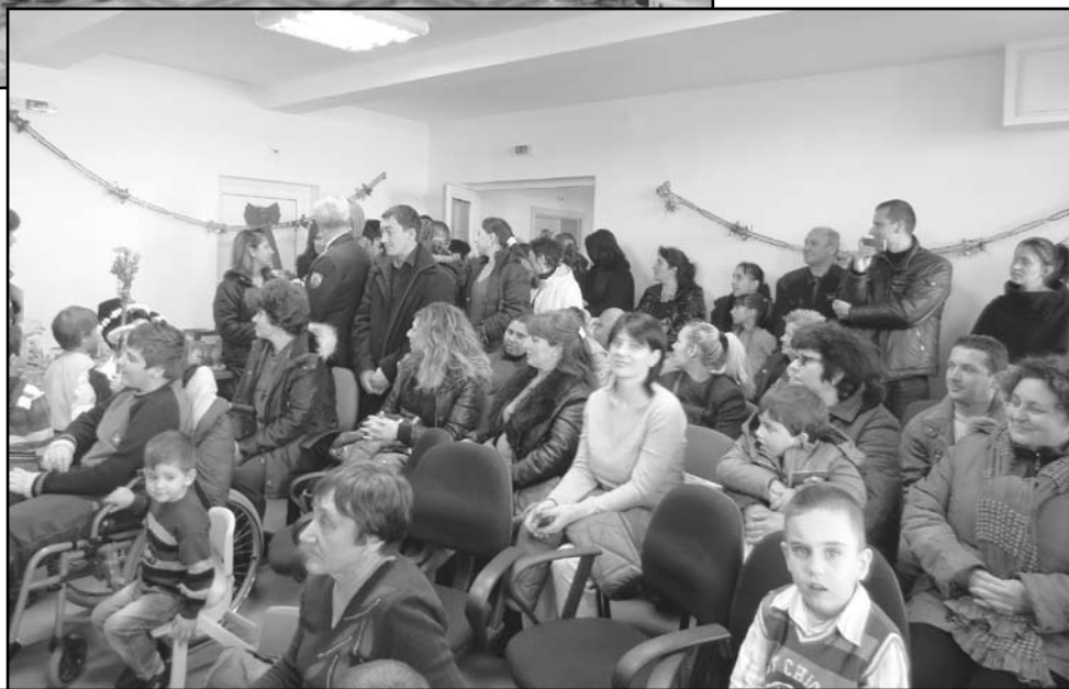
Родителите са тези, които подкрепят работата на педагозите и дейностите в учебните заведения

Всяка детска градина и всяка група в нея разработват мини-проекти, по които работят през цялата година. Темите се одобряват от ръководството на детското заведение и са съобразени с възрастовите особености на децата от различните групи. Дейностите по тези мини проекти, които са извънучебна дейност спомогат за обогатяване на педагогическия опит на учителите. За самите деца това е интересен и забавен начин