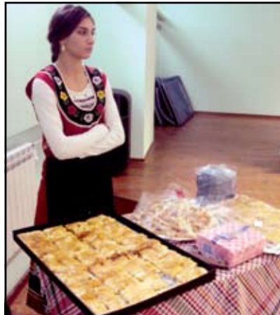
Приятелството и доброто настроение от този ден бяха подсладени с вкусни сладкиши и лакомства