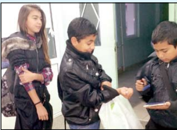
Всеки ученик от СОУ „Св.св. Кирил и Методий“ бе посрещнат с приятелска усмивка и поздрав и печат за съпричастност към всички, които споделят идеята за толерантност.