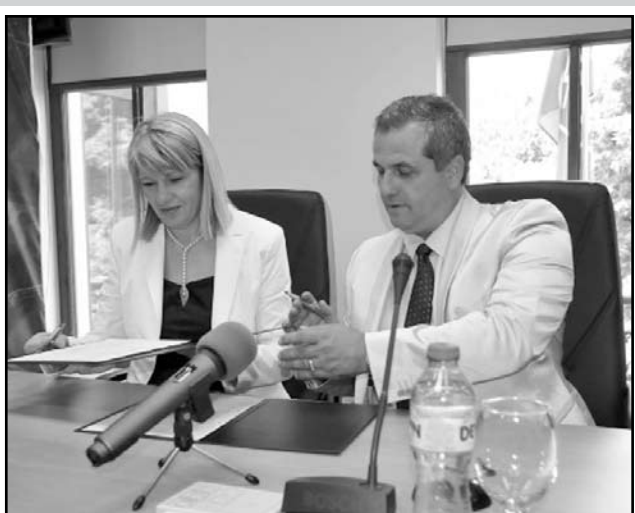
Стартът на най-големия проект на Созопол бе даден с подписване на договор за финансиране от министъра на околната среда и водите Нона Карджова и кмета на Община Созопол Панайот Рейзи

На 18.06.2013 г. е направена първата копка на обект „Входна помпена станция и напорен тръбо-