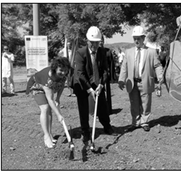
Град Черноморец е включен в Интегрирания проект, което дава възможност на града да се развие с бързи темпове като привлекателна и желана туристическа дестинация