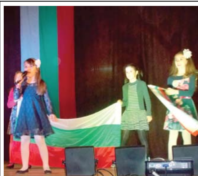
Красив спектакъл в град Черноморец отбеляза Деня на художествената самодейност и Освобождението на България.

В навечерието на националния празник НЧ „Димо Николов-1908“ организира концерт, в който взеха участие самодейните групи от читалището и деца от ОУ „Христо Ботев“. Патриотични стихове, кръшни български хора и красиви народни песни развълнуваха присъстващите, които наградиха участниците в спектакъла с бурни аплодисменти.