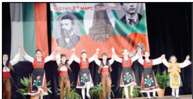
Малките самодейци представиха красив пролетен танц

Във фойето на читалището бе подредена и изложба на школата по изобразително изкуство. Така всички созополски самодейци показаха своя талант и заслужиха бурните аплодисменти на публиката.