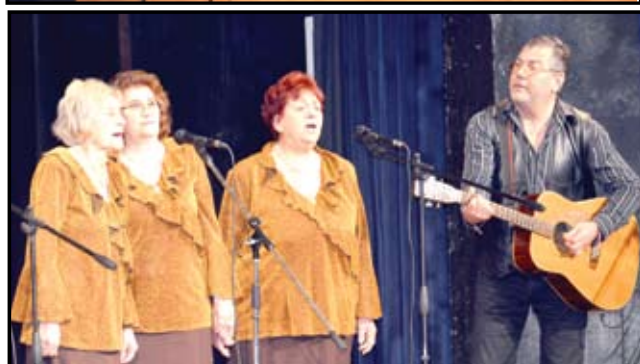
Нежни и завладяващи романси изпълниха дамите от групата за стари градски песни