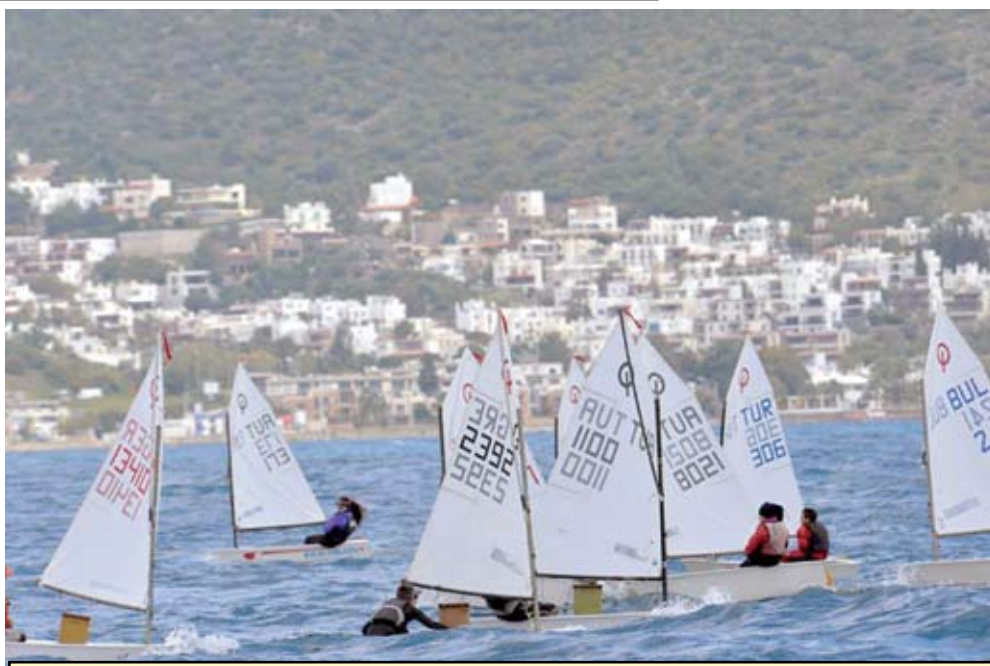
234 състезатели от 10 страни участваха в международната регата Bodrum International Optimist Regatta (BIOR).

Но най-впечатляващо в клас „Оптимист“ бе пред-