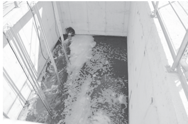
Отпадните води преминават през механично, пълно биологично пречистване и обеззаразяване.

Нека не пропускаме основната идея - Община Созопол е успяла да привлече външно финансиране за проект с висока екологична стойност - отпадъчните води на населено място като Равадиново с висок туристически потенциал да бъдат пречистени и по този начин гарантирана чиста околна среда и повишаване качеството на живот на местното население.